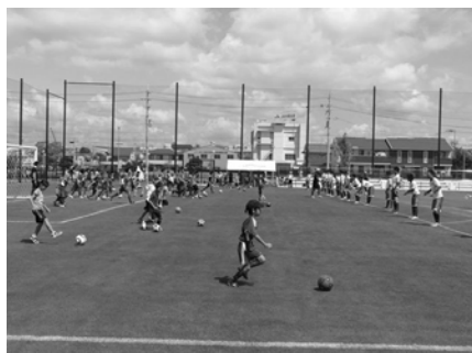
マルチグラウンドオープンイベント 大商学園サッカー部(男女)による教室の様子