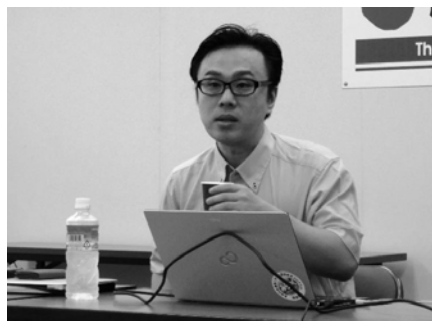
坪田信貴氏を囲んで勉強会 ベストセラー「ピリギャル」の著者です