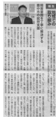
プレス民主で白岩の報告が特集される