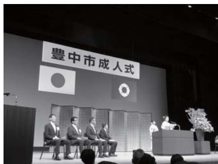
豊中市成人式 新成の前途を心から祝福