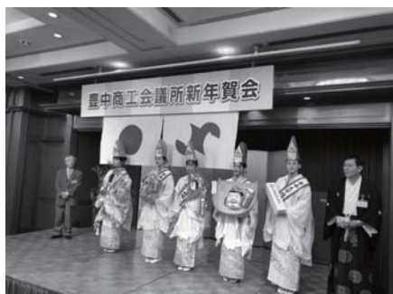
商工会議所新年互礼会 地域経済を支える皆さんと懇談