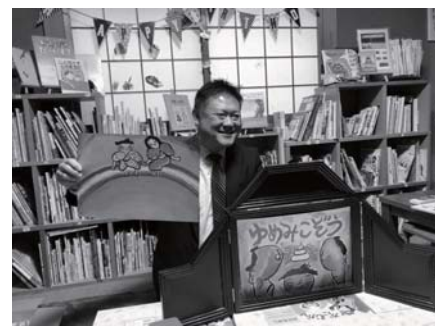
ゆめのき文庫へ紙芝居贈呈 豊中市民懇話会の活動を視察