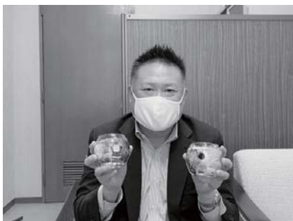
ハンドメイドキャンドル協会 障害者の自立支援の活動をヒアリング