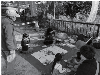
とよなか市民環境展 コロナ禍の特別態勢で開催