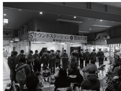
サウンドステーション in 豊南市場 キャンドルと音楽で素敵なクリスマス