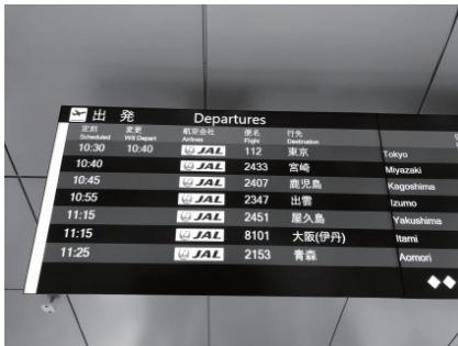
大阪国際空港の周遊ツアーに参加 大阪(伊丹)行きと掲示されています