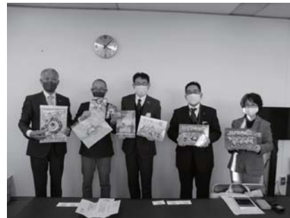
兄弟都市文庫に図書を寄贈 沖縄市・豊中市のそれぞれの図書館に